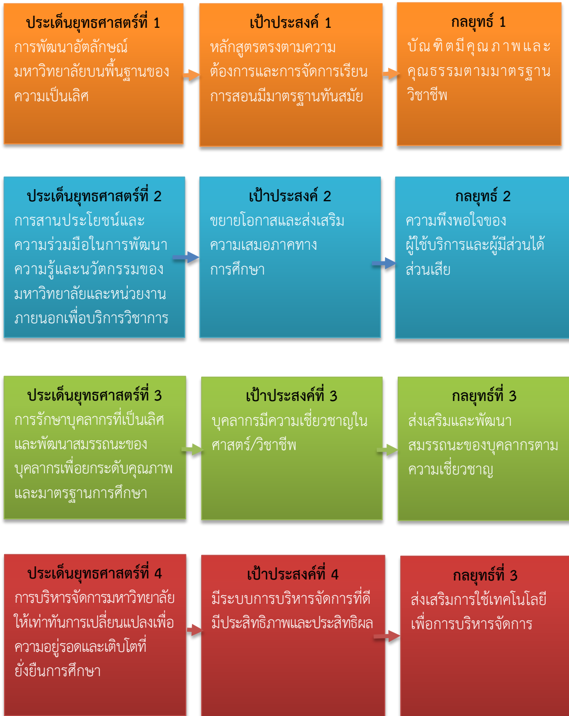
แผนภาพที่ 2.2 วัตถุประสงค์เชิงกลยุทธ์