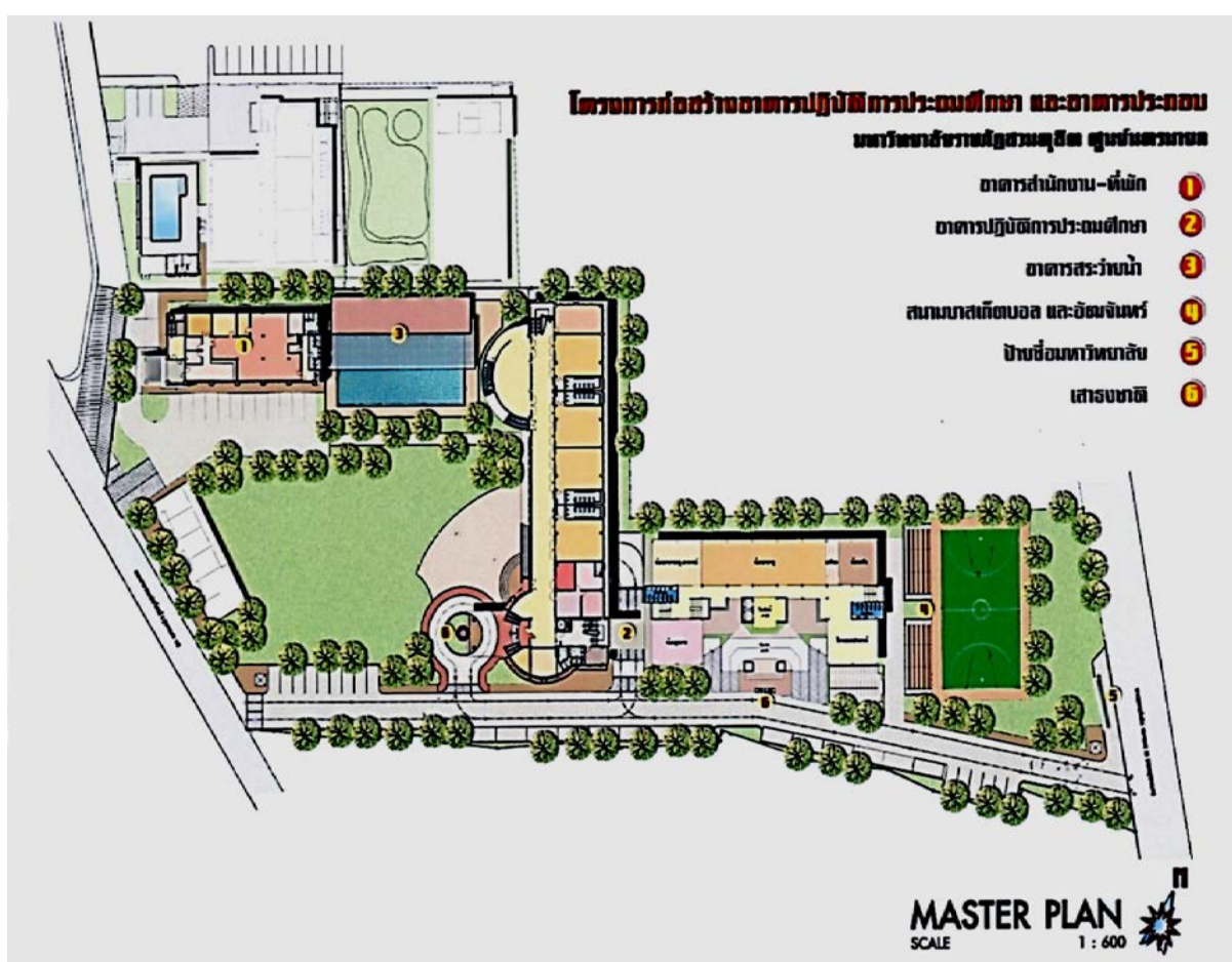
ผังแสดงแผนที่และบริเวณของหน่วยงาน