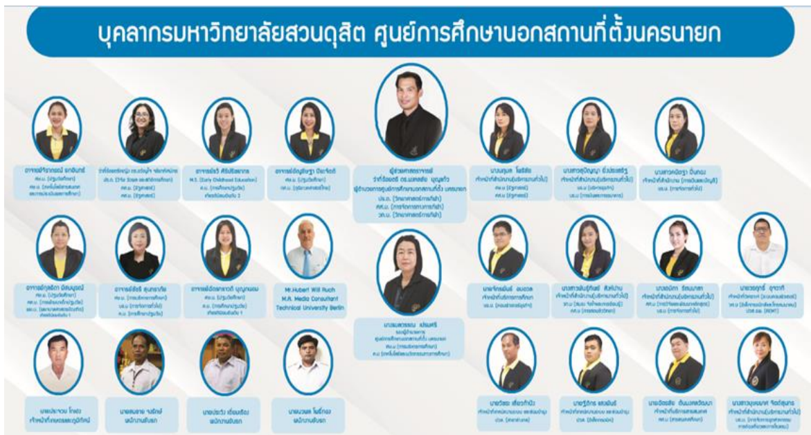
ผังบุคลากร